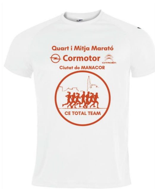
Camiseta JOMA d'obsequi per als primers 250 inscrits de les curses Quart i Mitja Marató

Medalla: Participants de les curses infantils (Fins a la categoria infantil)